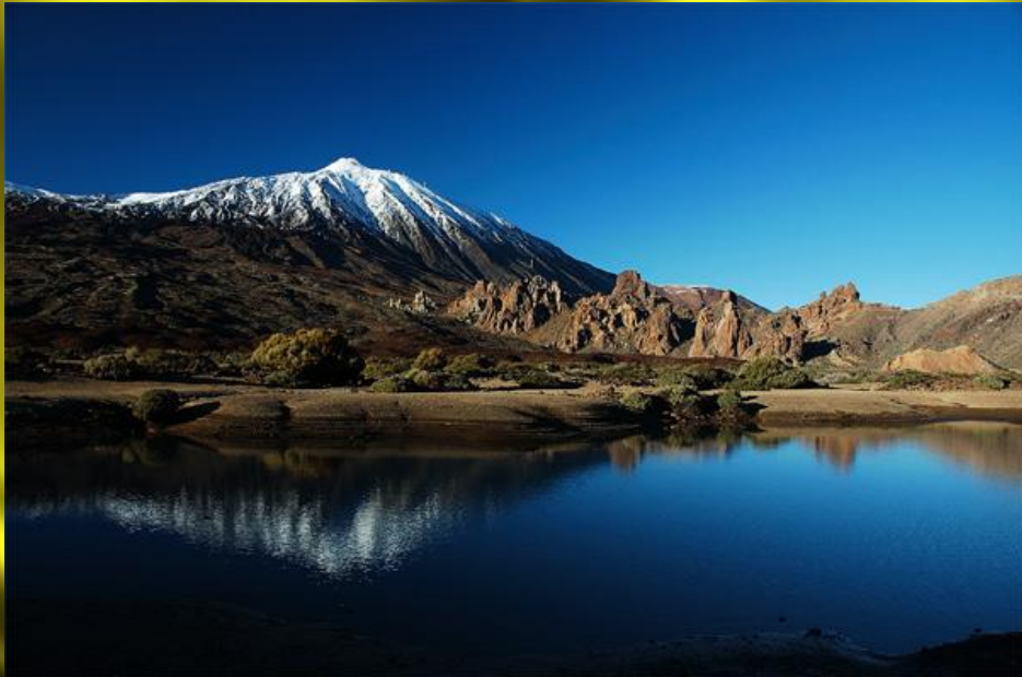
Teide (3.718 m), en la Isla de Tenerife (Canarias).